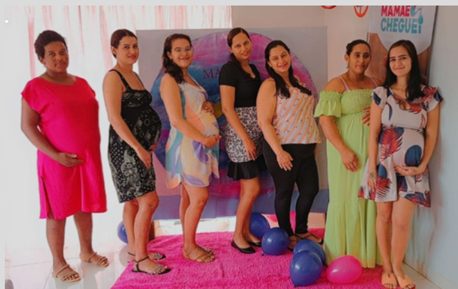
Oficina com as Gestantes