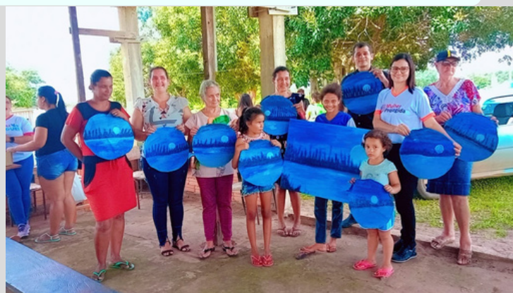
Projeto Pé na Estrada - Linha 105 (Ação comunitária)