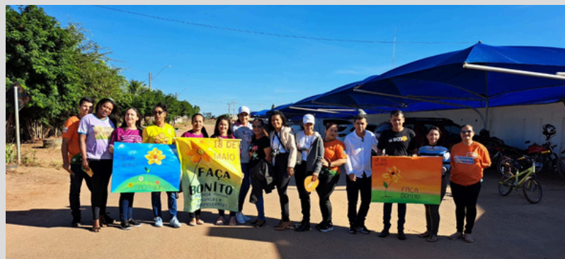
Ação Faça Bonito - Campanha em rede