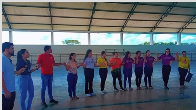
Projeto Pé na Estrada - Pé de Galinha (Ação comunitária)