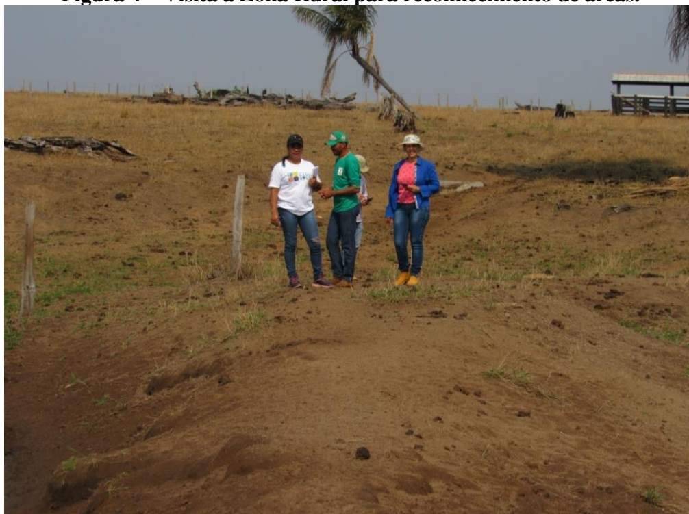
Figura 4 – Visita a Zona Rural para reconhecimento de áreas.