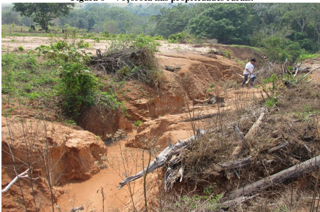
Figura 6 – Voçoroca nas propriedades rurais.