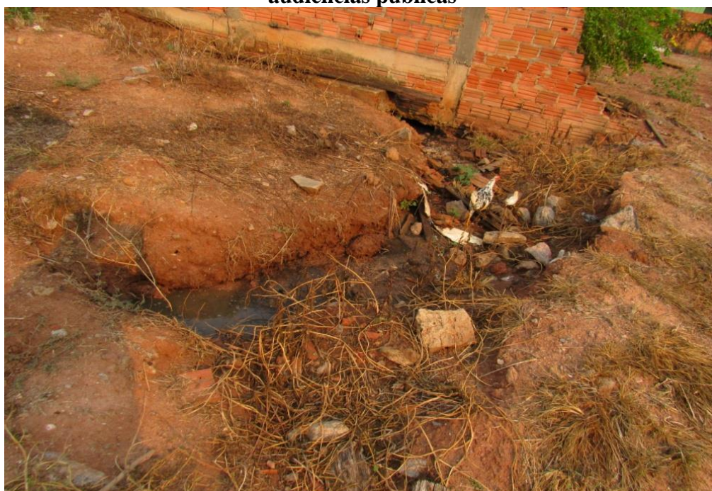
Figura 2 – Imagens de locais críticos na Zona urbana, apontados pelos munícipes nas audiências públicas