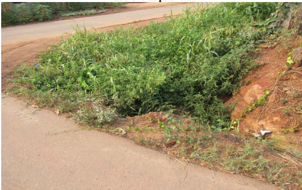
Figura 3 – Imagens de locais críticos na Zona urbana, apontados pelos munícipes nas audiências públicas