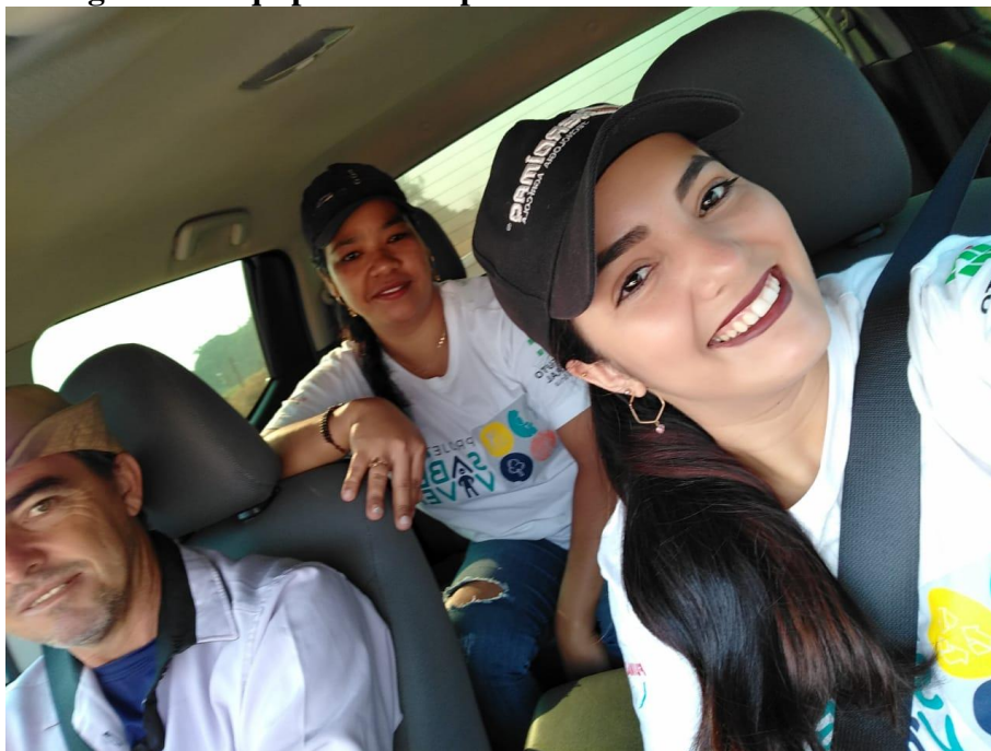
Figura 1 – Equipe reunida para o reconhecimento das áreas

Rua Jair Dias, Nº 150, Bairro Centro, Parecis/RO, CEP: 76.979-000; srp.pmparecisro@hotmail.com ; Fone: (69) 3447-1129/1256/1051/1205.