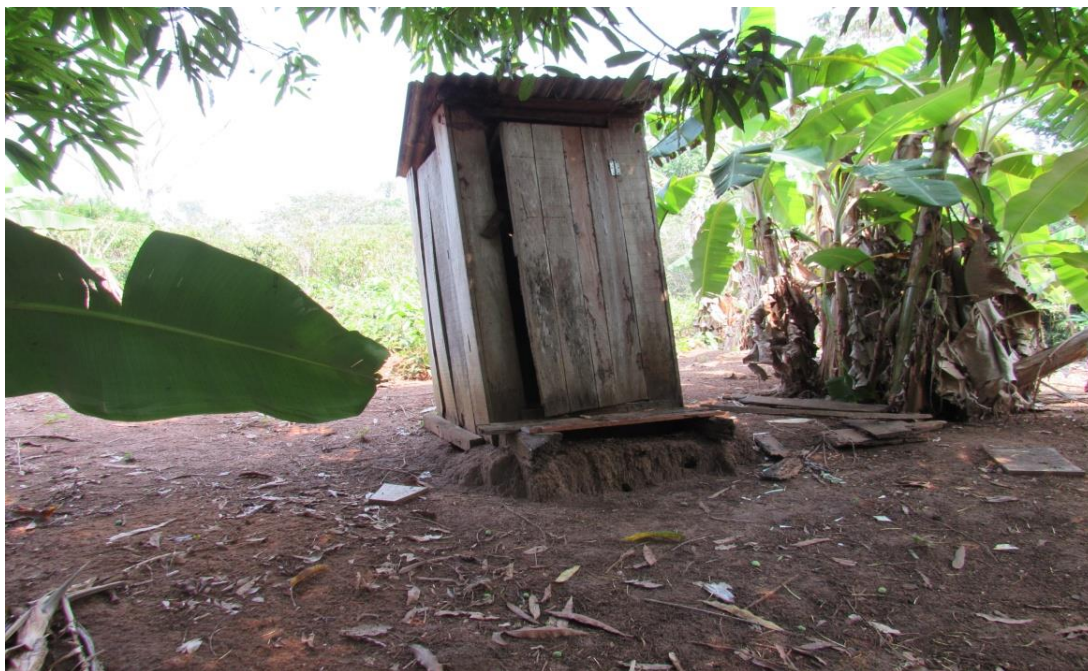
Figura 5 – Zona Rural

Rua Jair Dias, Nº 150, Bairro Centro, Parecis/RO, CEP: 76.979-000; srp.pmparecisro@hotmail.com ; Fone: (69) 3447-1129/1256/1051/1205.